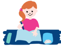
「家庭学習ワーク」などのワークブック